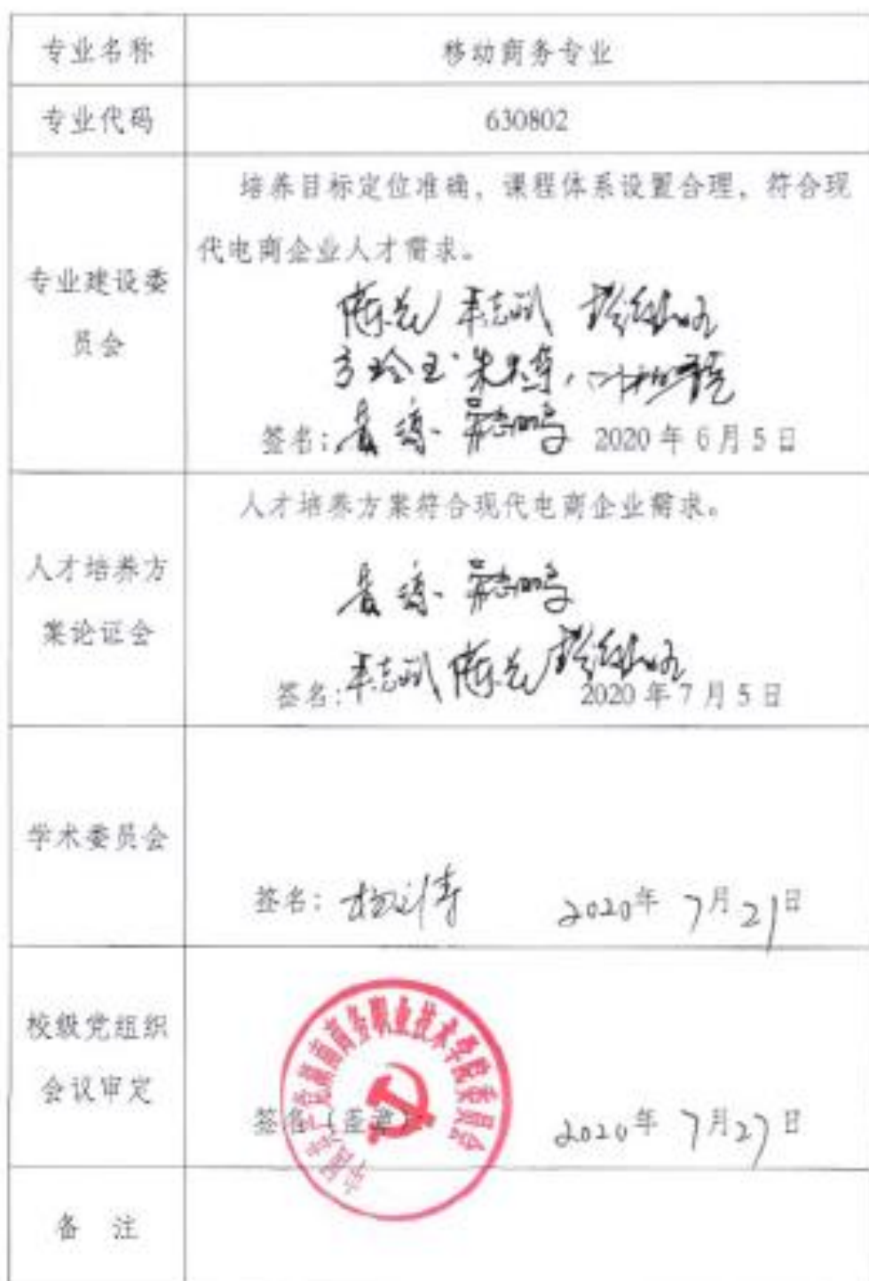
2020 级专业人才培养方案制订与审核表